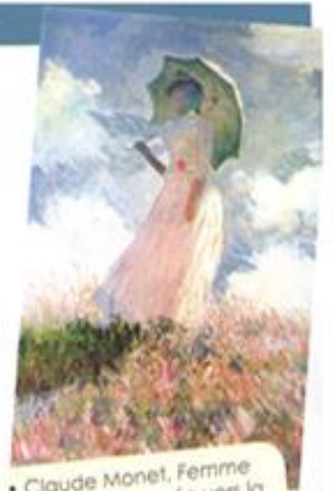
• Claude Monet, Femme à l'ombrelle tournée vers la gauche, 1866. •

Les tableaux des artistes aux XIX e siècle donnent toujours une impression de vie et de mouvement.