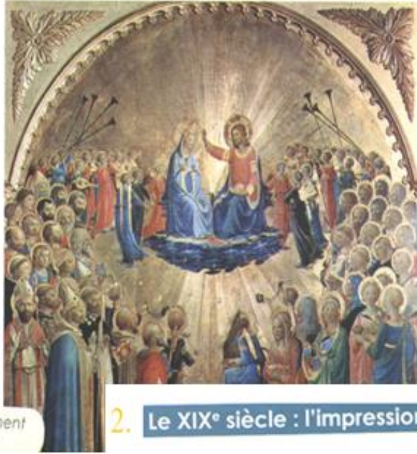
• Fra Angelico, Le couronnement de la Vierge, 1435-1436. •