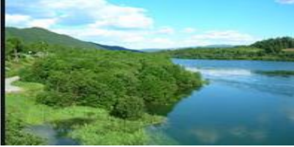
Les berges d'un fleuve