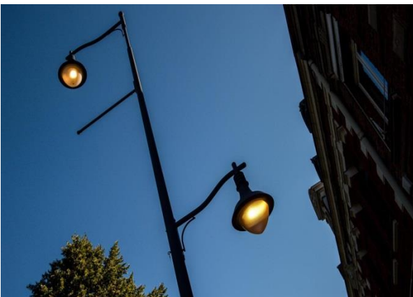
Un éclairage public